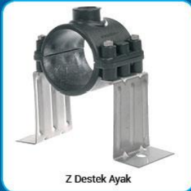
Z Destek Ayak