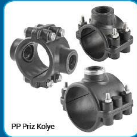
PP Priz Kolye