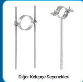
Diğer Kelepçe Seçenekleri