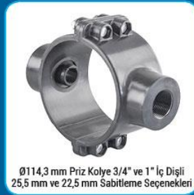
Ø114,3 mm Priz Kolye 3/4" ve 1" İç Dişli 25,5 mm ve 22,5 mm Sabitleme Seçenekleri