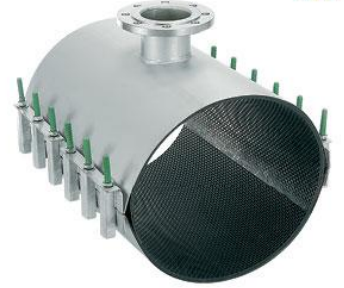
Flanş ve Manşon Çıkışlı Kelepçeler ATT, ATC ve ATS modelleri.